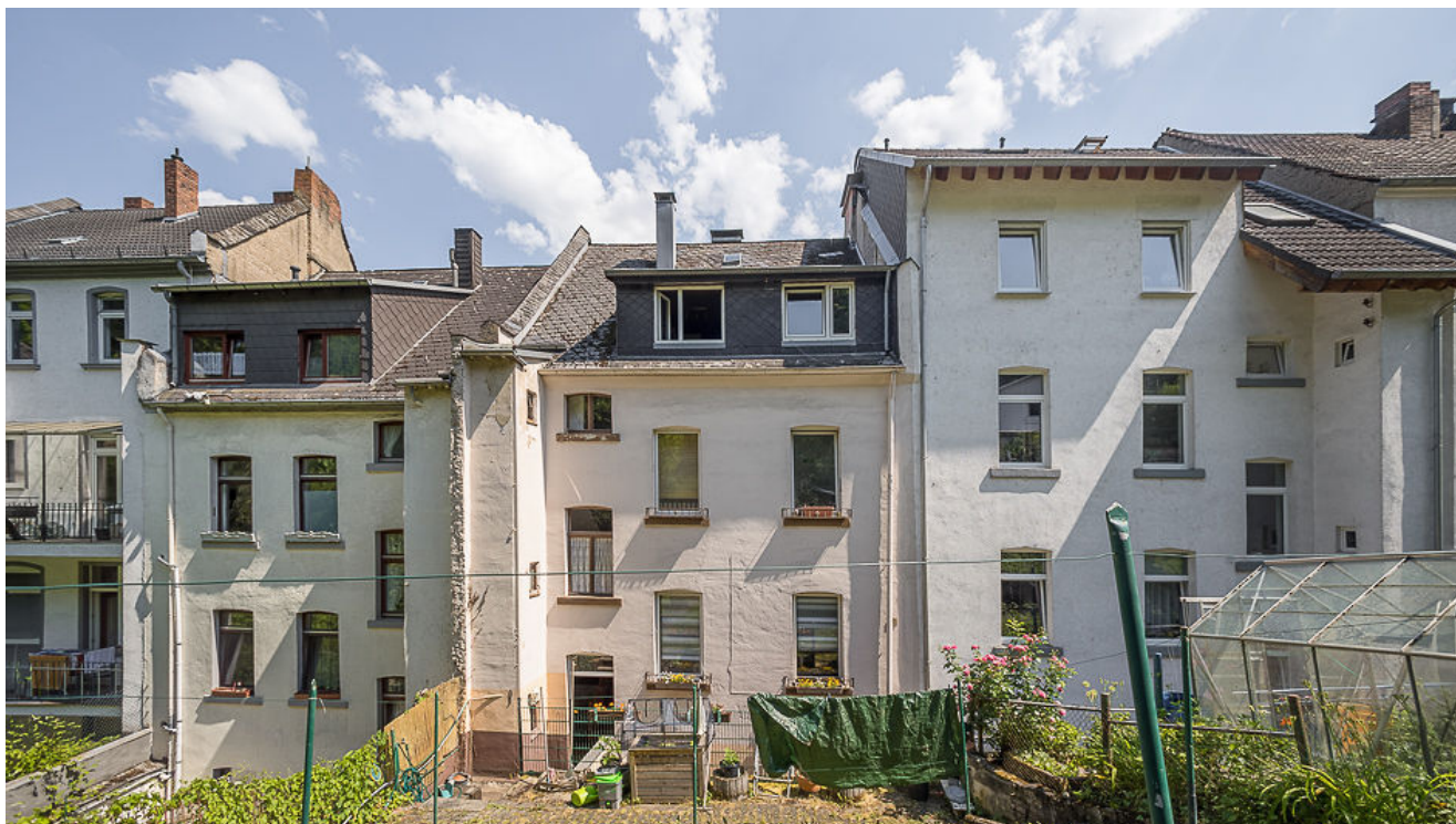
Blick vom Garten