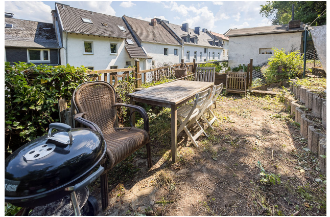
Gemeinschaftsterrasse - Grillplatz