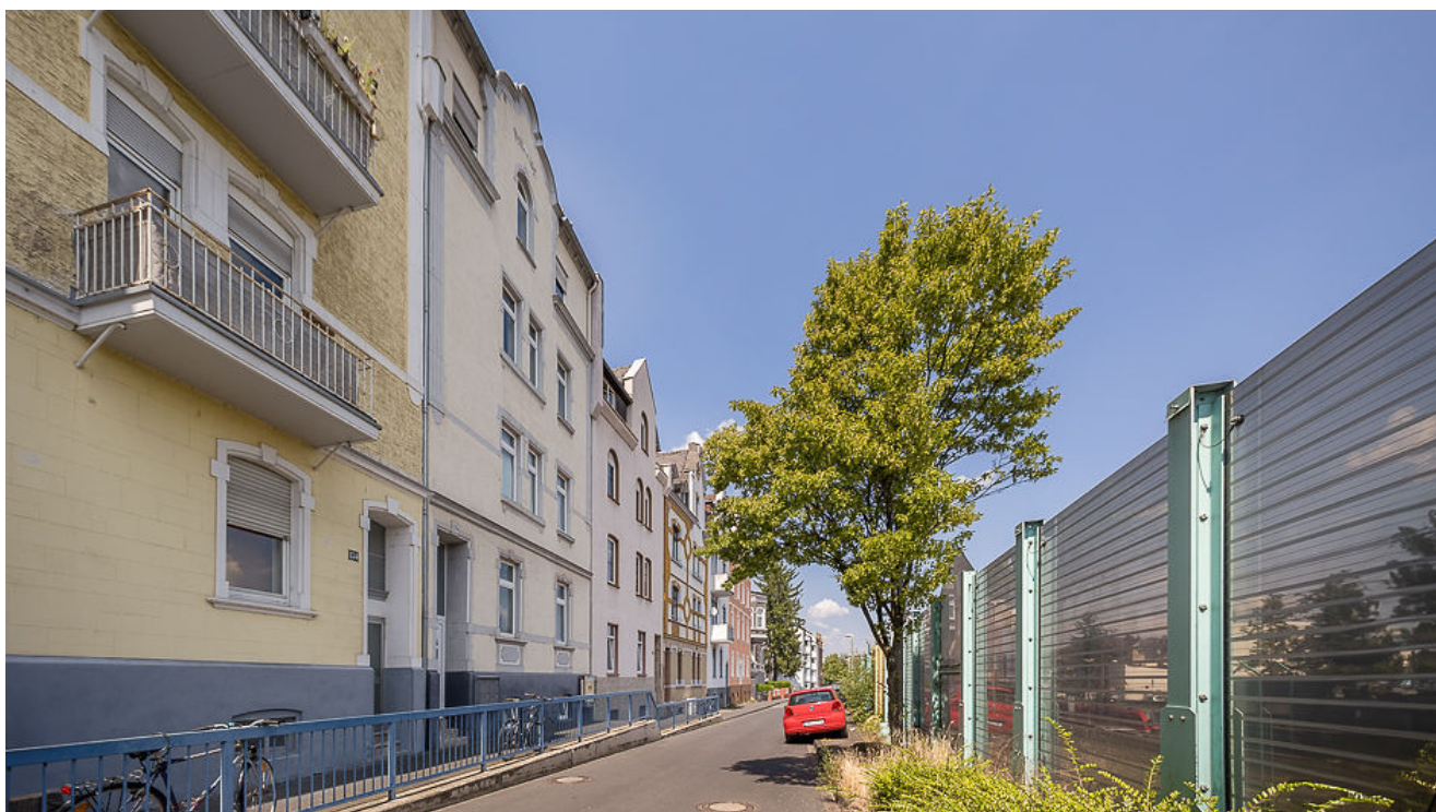
Blick über die Straße