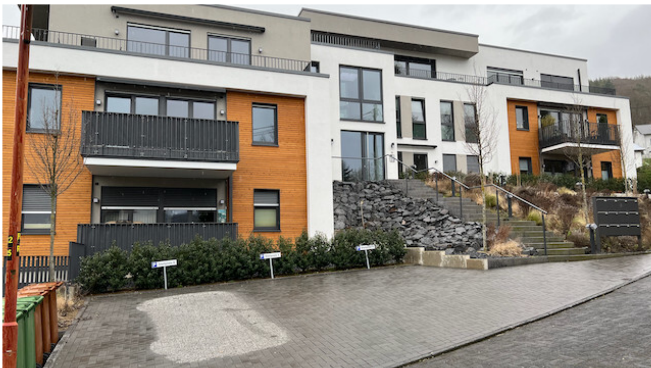
Blick vom Parkplatz