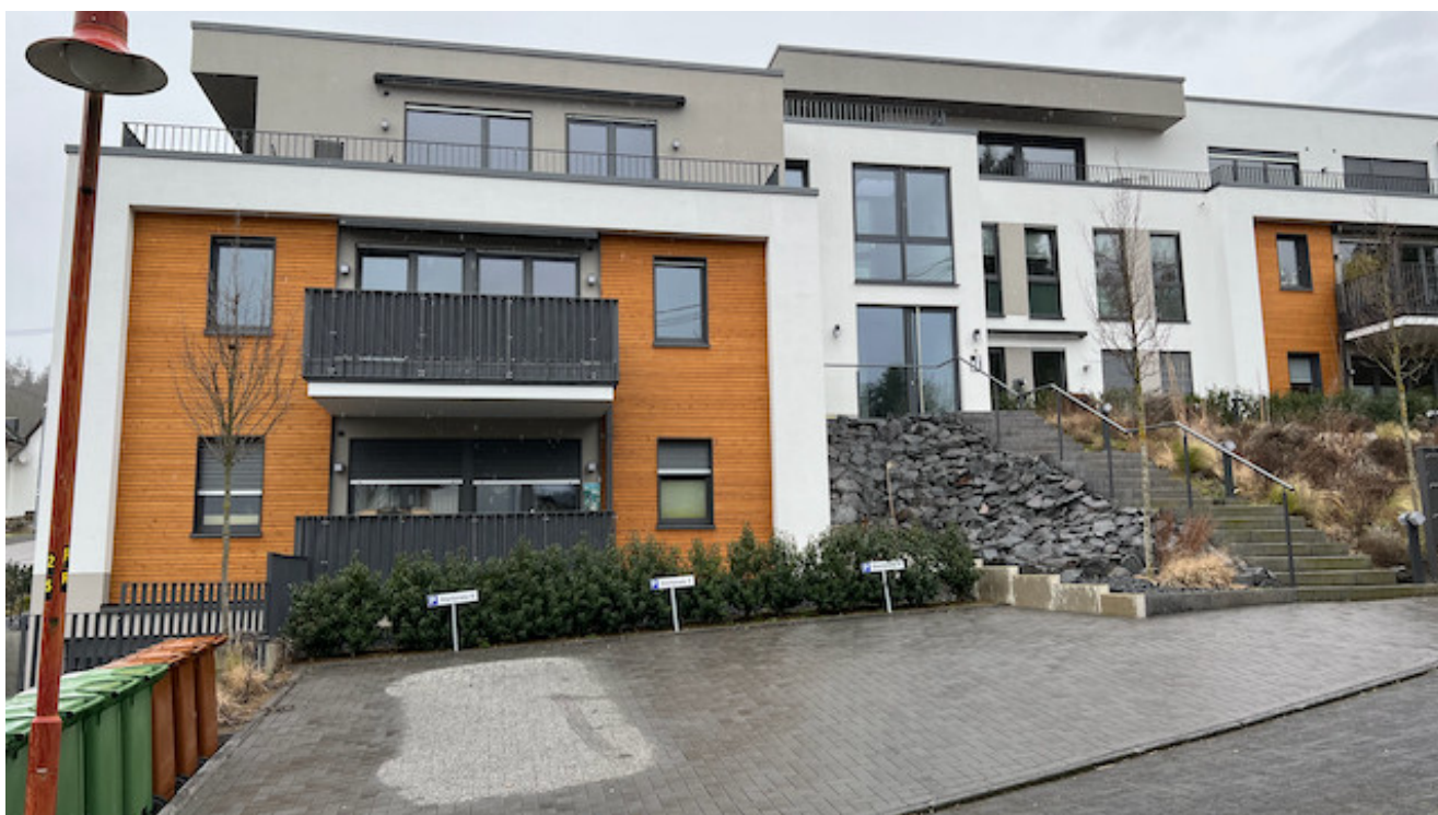
Blick auf die Wohnung